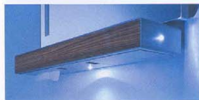
Linea arredobagno di Duravit con sistema di illuminazione intelligente, regolato in funzione dell'intensità della luce ambiente. Di notte rimane accesa una spia, per garantire un minimo di visibilità.