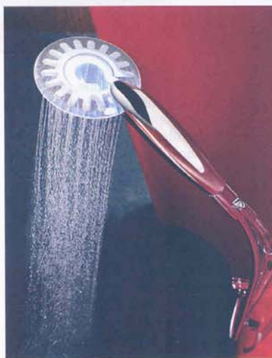
Il soffione doccia con cromoterapia integrata, alimentata a pile, proposto da Hansa, con corpo interamente trasparente in modo da colorare i filetti dell'acqua lungo tutto il percorso di erogazione.

Molto gettonata la possibilità di inserire i led attorno alla bocca di erogazione per illuminare direttamente i filetti di flusso. La soluzione è stata utilizzata soprattutto per la doccia. Anche in questo caso, la menzione per l'innovazione spetta ad Hansa, che ha realizzato un soffione doccia sottilissimo, prestampato in materiale trasparente, con un pacco di led montati in testa all'impugnatura che consente di