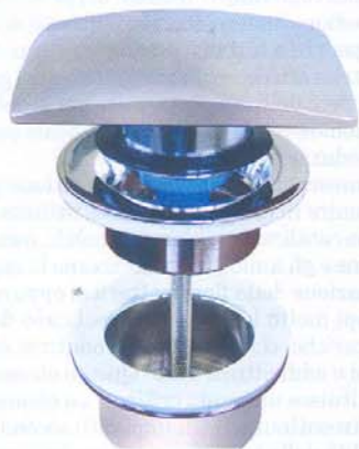
Tappo stop & go con chiusura a scatto (Valpra).

» ancora con sorgenti tradizionali. A indagare sulle potenzialità delle nuove lampade è stata Duravit, che per prima propone un sistema di illuminazione modulare integrato nell'arredo, a partire dalla mensola di appoggio del lavabo, organizzata in modo da avere prese a scomparsa, con un sensore che misura il livello di luminosità e, quando scende sotto una certa soglia, accende una luce di cortesia a basso consumo, per guidare le persone anziane e i bambini al buio. Non mancano le sorgenti fluorescenti per l'illuminazione dello specchio e i led multicolore per ricreare un ambiente rilassante. I led, per le ridottissime dimensioni e soprattutto per il fatto che necessitano di basse tensioni di alimentazione, non pericolose al contatto diretto con i cavi o con l'acqua, stanno rimpiazzando, in un crescendo strepitoso, qualunque altra soluzione illuminotecnica per il bagno. In questo momento l'interesse dei designer è concentrato soprattutto sulla possibilità di cambiare i colori, per creare ambientazioni particola-