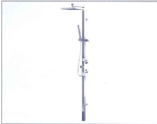
PLAIN SQUARE Design: Marco Piva

• Dalla semplicità del gesto quotidiano alla semplicità delle forme. La colonna doccia con termostatico e soffione accoglie un meccanismo soft brevettato che permette la regolazione dell'acqua con due sole dita. Garantisce un risparmio di acqua superiore al 95% grazie al sistema brevettato Valpra (Compact).